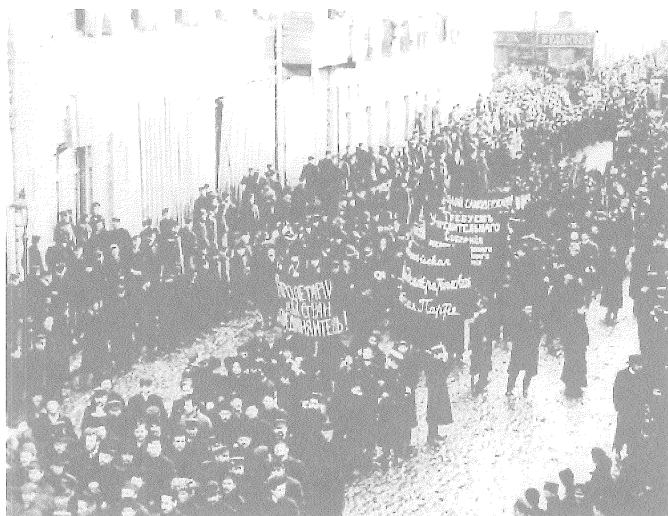
Αγ. Πετρούπολη, 1905

Ο στόχος αυτής της εισήγησης 3 είναι να αναπτύξουμε την έννοια της επίδρασης του έρωτα ως αναλυτικό εργαλείο με το οποίο μπορεί να επανανοηματοδοτηθεί το ως σήμερα διχοτομημένο πεδίο των κοινωνικών κινημάτων και της συλλογικής συμπεριφοράς και να γίνουν καλύτερα κατανοητά τα κοινωνικά φαινόμενα που εμπίπτουν σ' αυτό. Στην ουσία, η επίδραση του έρωτα αναφέρεται στην ιδιότητα των κοινωνικών κινημάτων να κάνουν υπερβάσεις, σ' αυτό δηλαδή που συμβαίνει σε στιγμές ξαφνικών λαϊκών κοινωνικών εξεγέρσεων οι οποίες αλλάζουν δραματικά την καθεστηκία κοινωνική τάξη. Όπως θα δούμε στη συνέχεια, η επίδραση του έρωτα συμβαίνει σε φάσεις που οι βασικές προϋποθέσεις μιας κοινωνίας -πατριωτικός εθνικισμός και εξουσία της κυβέρνησης, ιεραρχία, καταμερισμός εργασίας και εξειδίκευση- καταρρέουν εν μία νυκτί. Κατά τη διάρκεια των φάσεων επίδρασης του έρωτα, τα λαϊκά κινήματα όχι μόνο φαντάζονται ένα νέο τρόπο ζωής και μια διαφορετική κοινωνική πραγματικότητα, αλλά εκατομμύρια άνθρωποι ζουν σύμφωνα με νέους κανόνες, αξίες και πεποιθήσεις.